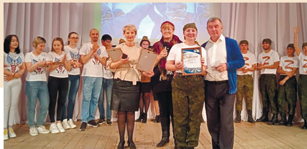
Церемония награждения сотрудников Центральной городской больницы г. Сибай

Энергичные и артистичные участники проявили находчивость и смекалку и смогли доказать, что, будучи профессионалами в своем деле, они и к творческим состязаниям подходят со всей ответственностью. Великолепно поставленные номера «Медицина – во имя спасения мира», заключительного задания конкурса, были настоящими мини-спек-